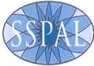
Scuola Superiore Pubblica Amministrazione Locale